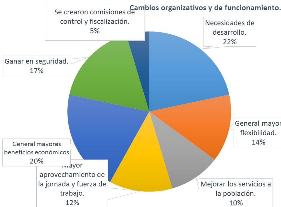
Tabla I. Cambios organizativos y de funcionamiento. CNA Inducidas. Elaborado por el autor.

Los gráficos que se presentan a continuación, muestran el comportamiento de los indicadores que se obtuvieron en entrevista-cuestionarios a presidentes y entrevistas colectivas a muestras de los socios, referidos a los cambios organizativos y de funcionamiento de las CNA (inducidas y no inducidas).